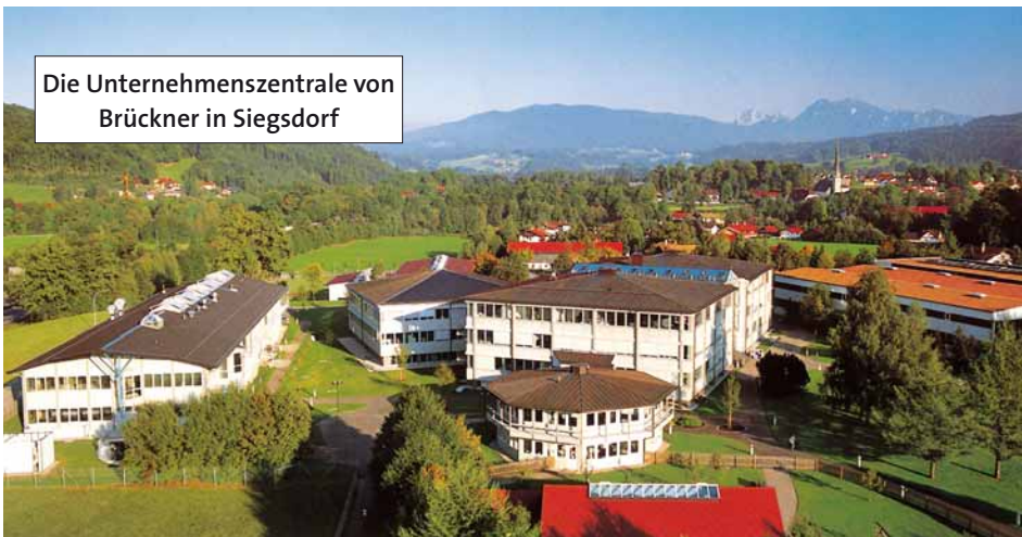
Die Unternehmenszentrale von Brückner in Siegsdorf

Kröter und sein Team zeigen sich ausgesprochen zufrieden: »Eigentlich hätte es kaum besser laufen können. Das einzige, wobei uns Cockpit anfangs noch nicht optimal unterstützt hat, war die direkte Aufnahme von Änderungswünschen während unserer Kundengespräche.« Von Arcway als Übergangslösung zunächst außerhalb des Werkzeugs realisiert, umfasst Cockpit inzwischen eine Offline-Version, mit der diese individuellen Kundenanpassungen direkt im Vertriebsgespräch erfasst werden können. Daraus lassen sich Änderungen am UML-Modell ableiten, anhand dessen der Generator dann automatisch die Software für den Kunden erstellt. Damit kann Brückner auch in Kundenprojekten schnell reagieren. □